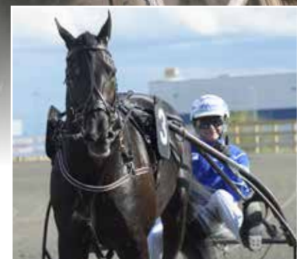
Very Kronos.

TVILLING TVILLING går ut på att hitta de två hästar som är 1:a och 2:a i mål i ett lopp, oavsett ordningsföljd. Vilken av de två främsta hästarna som kommer först i mål spelar alltså ingen roll. Tvillingoddset anger utdelningen per satsad krona/kombination.