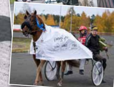
Tidigare vinnare av Steggbest Minne