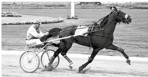
Dun Bunter och Stig på Solvalla.

Travtränare runt om i landet stämmer in i hyll-