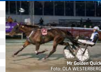
Mr Golden Quick