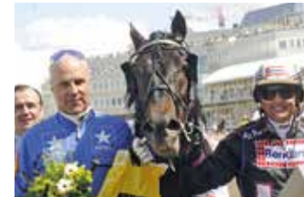
Hallsta Lotus har vunnit Elitkampen.