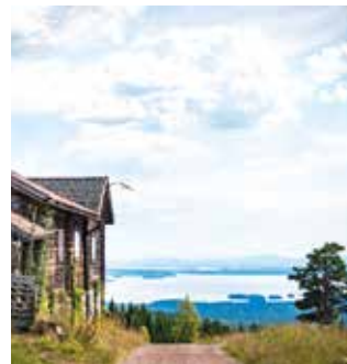
1. Hitta vackra vyer

Hitta nya platser och tidigare dolda guldkorn, här är tre av våra tips!