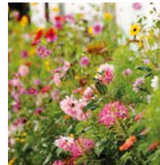
2. Besök en trädgård