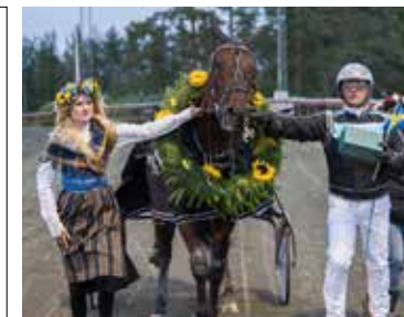
Midsommarkransen 2019: Whipped Eggs