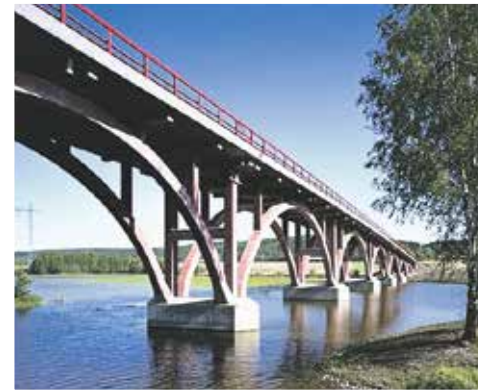
Betongbro av rödfärgad betong. Södra Fryken i Värmland.

Dahlgrens Cementgjuteri tillverkar och levererar dom flesta Betongprodukter ni kan behöva till VA anläggningar, järnvägs och vägprojekt. Avskiljning (fett, olja, avlopp för spill och dagvatten).