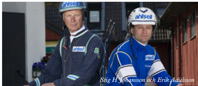
Stig H Johansson och Erik Adielsson

Segerrikaste kuskar på V75 (inklusive tidigare V65) och övriga rikstotolopp åren 1974 till 2010.