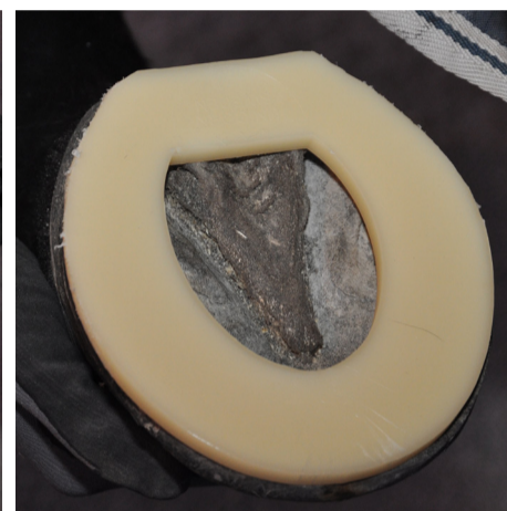
Plastsko, fäst med söm eller limmad Plastic shoe fixed with nails or glue