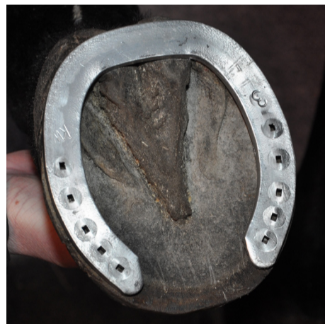
Tåöppen sko i järn eller aluminium Open toe shoe, iron or aluminum