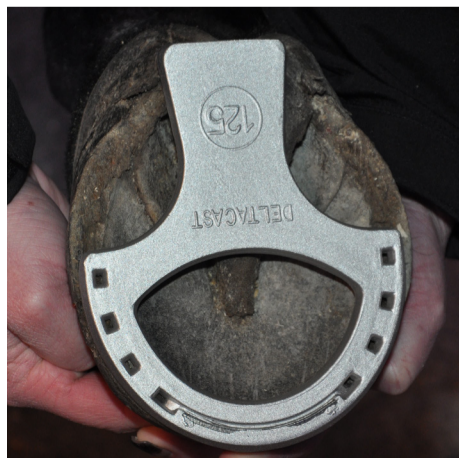
Päronsko i järn eller aluminium Mushroom shoe, iron or aluminum