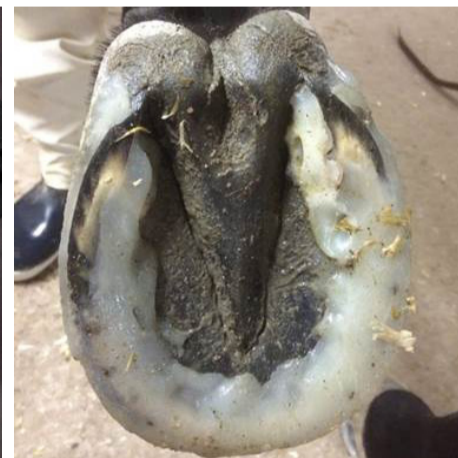
Plastad hov Plastic-coated hoof