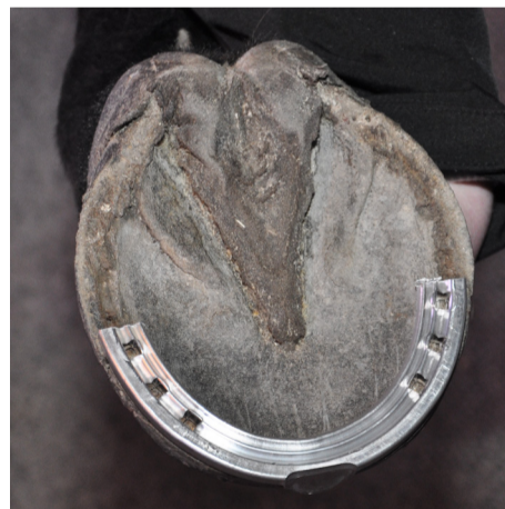
Tåsko, med eller utan plast Toe shoe, with or without plastic