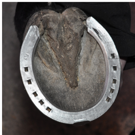
Vanlig järn- eller aluminiumsko Regular iron or aluminum shoe