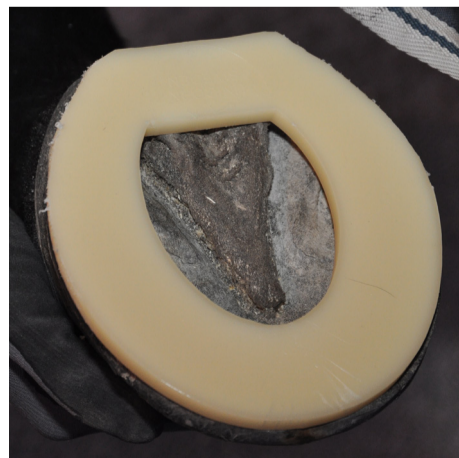
Plastsko, fäst med söm eller limmad Plastic shoe fixed with nails or glue

Banveterinären och/eller måldomaren kan dessutom besluta om ett tillfälligt barfotaförbud. Vid ett sådant beslut ska hästen tävla med beslag som täcker hela bärranden.