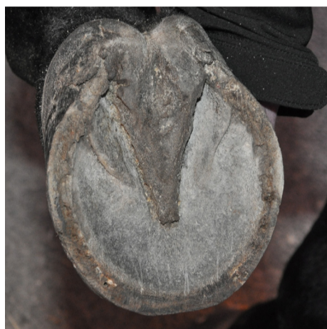
Hov helt utan beslag Bare hoof