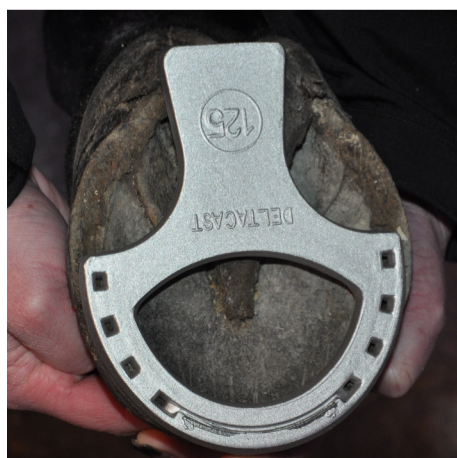
Päronsko i järn eller aluminium Mushroom shoe, iron or aluminum