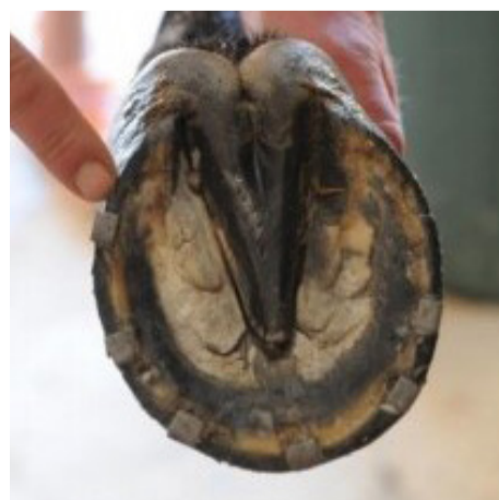
Hov med skyddssöm Hoof with nails only

Banveterinären och/eller mål- domaren kan dessutom besluta om ett tillfälligt barfotaförbud.